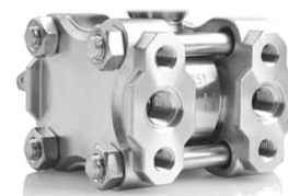
Différentielle MSD capteur piézorésistif monocristallin